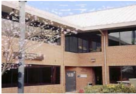
Centro de Gobierno Sudley North 7969 Ashton Avenue Manassas, Virginia 20109