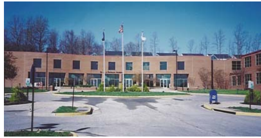
Centro de Gobierno A.J. Ferlazzo 15941 Donald Curtis Drive, Suite 200 Woodbridge, Virginia 22191